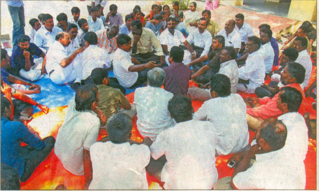
பாளை அரசு சித்த மருத்துவக்கல்லூரியில் முதலாம் ஆண்டு வகுப்புகளை தொடங்க கோரி நடைபெறும் தொடர் போராட்டத்தில் நேற்று அனைத்து கட்சி பிரதிநிதிகள் கலந்து கொண்டு ஆலோசனை நடத்தினர்.